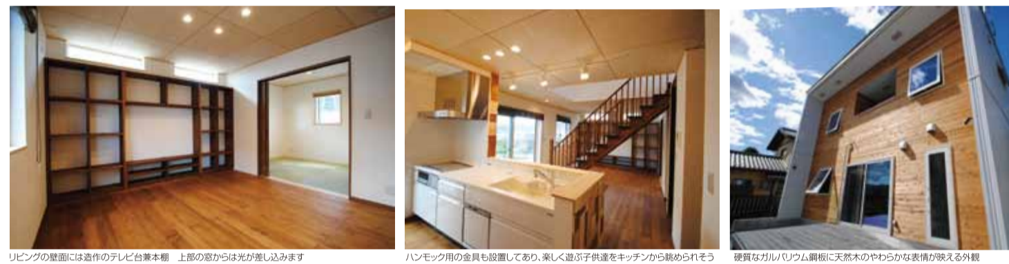
リビングの壁面には造作のテレビ台兼本棚 上部の窓からは光が差し込みます

安全性能や調湿性、防臭、耐火性など漆喰のメリットもさることながら、その「白」は室内を明るくし、対比で木の色味や質感を引き立てる効果があるからです。職人が手作業で仕上げる漆喰の表情も、クロスには無い味わいがあります。 床は肌ざわりがやわらかなパイン無垢材をシックなブラウンの自然塗料で仕上げ、天井はソフトベージュの色と木目がキ これまでも紙面で紹介してきたお宅もそうですが、お施主様の思い、営業や設計の提案、施工するスタッフの技術、それらすべてが融合してそのご家族らしいオンリーワンの住まいが出来上がる。注文住宅の醍醐味とも言えるでしょう。 そしてまた、そんな醍醐味を具現化したような新たなお住まいが誕生した。新たなお住まいが誕生した。新たなお住まいが誕生した。新たなお住まいが誕生した。