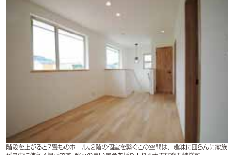
階段を上がると7畳ものホール。2階の個室を繋ぐこの空間は、趣味に即入んに家族が自由に使える場所です。眺めの良い景色を採り入れる大きな窓も特徴的