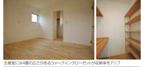
主寝室には4畳の広さがあるウォークインクローゼットが収納率をアップ