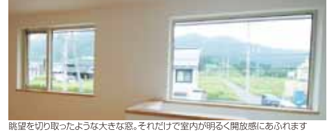
眺望を切り取ったような大きな窓。それだけで室内が明るく開放感にあふれます

生まれ事故に繋がります。しかし実は駐車場は見通しが悪く、歩道が整備されていないため歩行者との接触が懸念される場所。歩行者も運転者も油断して通常とは違う動きをしてしまいます。夏休み中は特に家族での外出や駐車場内に子供たちが増える時期にもなります。安全確認を怠ることのないよう、認識を高める講習となりました。