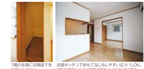
1階の住居には階段下を利用した収納が 対面キッチンでおもてなししやすい広々LDK。2階の居室はもう1部屋プラスされた2LDKです。

去る6月20日(土)21日(日)の2日間、当社による新築アパートの完成見学会が行われ、土地活用を考える多くのお客様のご来場をいただきました。 今回完成した物件は重層タイプと呼ばれるアパートで、1階LDK、2階2LDKの6世帯分の玄関が1階にそれぞれ配され、住む人のプライバシーに配慮した造りになっています。共有階段や外廊下を持たないため、共有部分の掃除やメンテナンスの負担が少ない点が皆さんのメリットにもなります。 また当日は同時に戸建賃貸住宅も見学することが出来ました。重層タイプは1~2人暮らしに、戸建タイプはファミリー層に人気の賃貸住宅です。弊社では施工はもちろん、市場とタイ