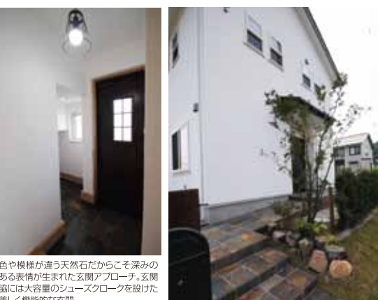
色や模様が違う天然石だからこそ深みのある表情が生まれた玄関アプローチ。玄関脇には大容量のシューズクロークを設けた美しく機能的な玄関

きつかけは、くしやみの出なかつたモデルハウス 緑の風景もインテリアに採り入れたかわいい家