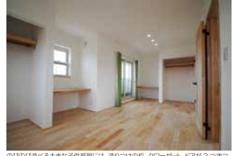
のびのび遊べる大きな子供部屋には、遊びの前後、クローゼット、ドアが2つずつ。将来は間仕切りを設けて2部屋としても使えます