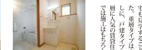
浴室、洗面室、トイレは個別に空間を確保したタイプが人気です